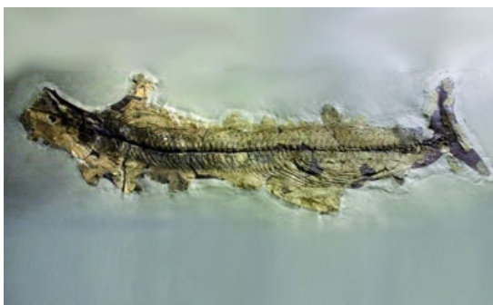
Palaeorhynchus humorensis

Aici s-au descoperit resturi fosile de pești preistorici (specii ce aparțin genurilor Lepidopus , Alosa , Scorpaena , Sardinella , Clupea etc) situate în marne, gresii și conglomerate. Printre acestea s-a găsit și un pește lung de 1,8 m ( Palaeorhynchus humorensis ) în partea superioară a stâncii, într-o intercalație subțire de argile disodilice prinsă între stratele groase de gresii albe relativ dure (de Kliwa), care formează actual peretele exterior al Pietrei Pinului.