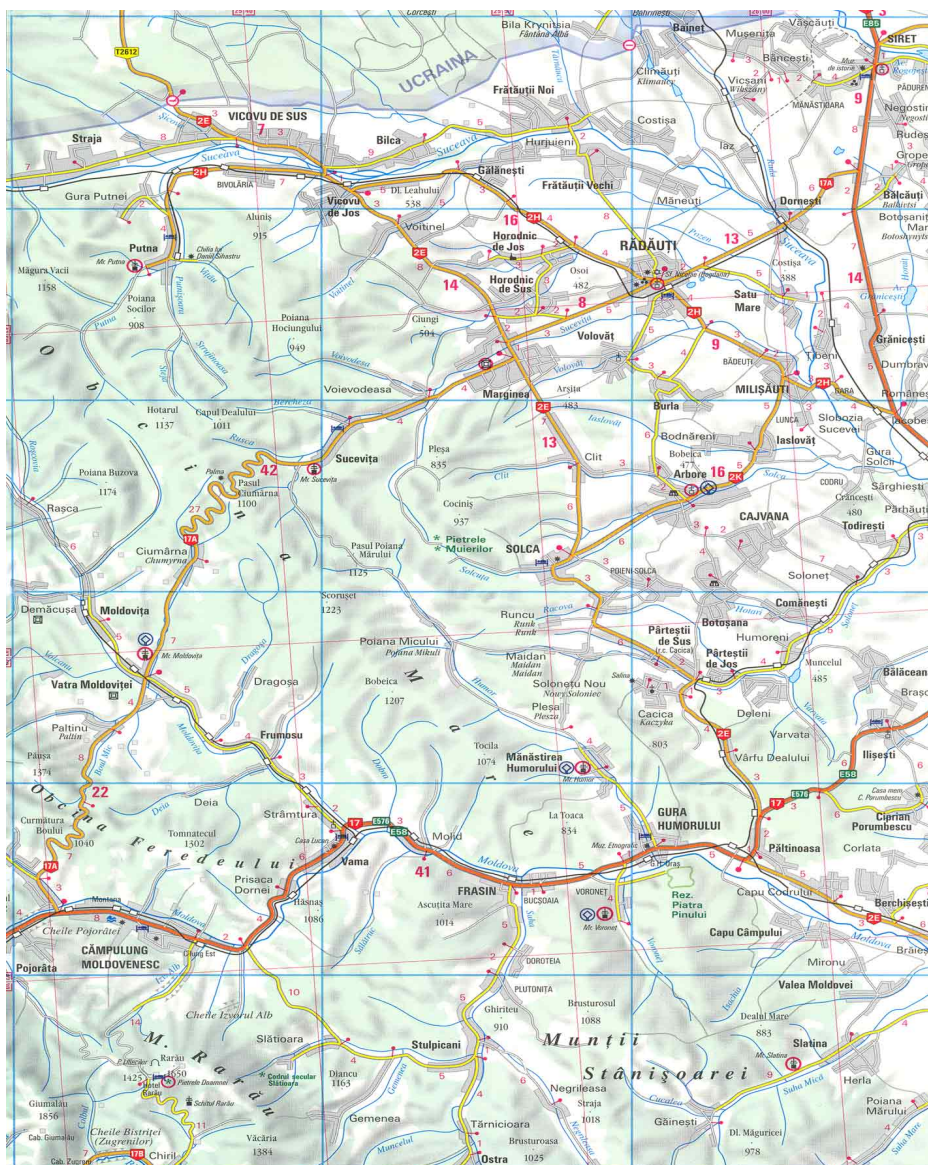
Harta Rezervatiei Piatra Pinului și Piatra Șoimului