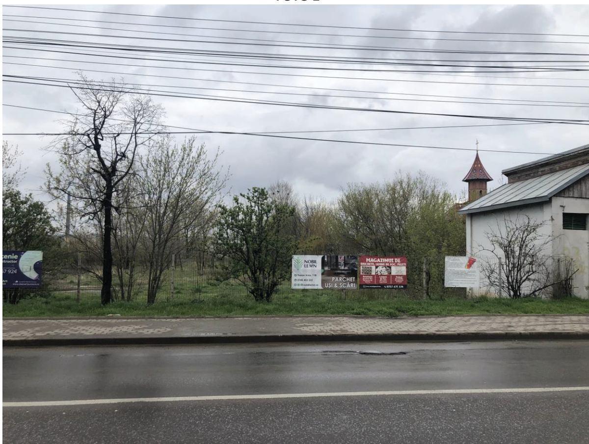
Vedere din str. Gheorge Doja E58 _1