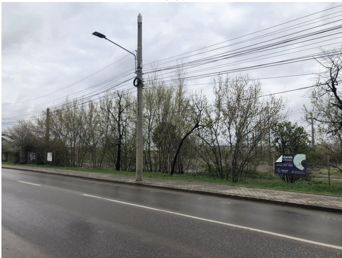
Vedere din str. Gheorge Doja E58 _1

- folosințele actuale și planificate ale terenului atât pe amplasament, cât și pe zone adiacente acestuia