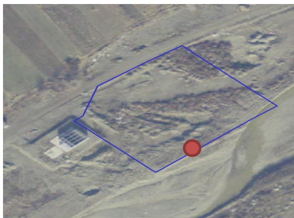
Fig. 1. Plan de amplasare în zonă