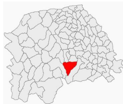
Poziția în cadrul județului SUCEAVA