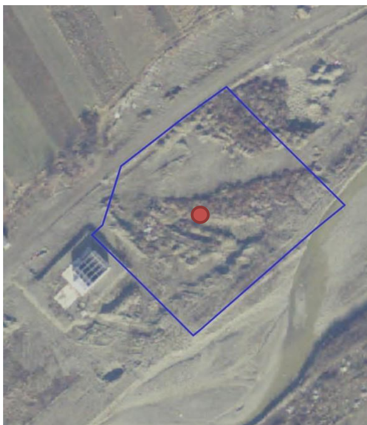
Fig. 1. Plan de amplasare în zonă

– distanța față de granițe pentru proiectele care cad sub incidența Convenției privind evaluarea impactului asupra mediului în context transfrontieră,