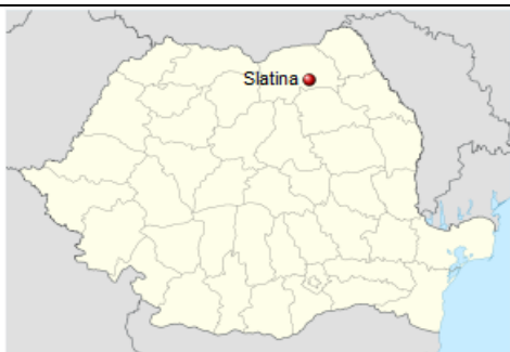
Poziționare Com. SLATINA

Această comună este așezată în bazinul Suha Mica, parau care este afluentul râului Moldova de pe malul drept, se află la o altitudine de 460 m. Amplasarea proiectului este în Regiunea de Dezvoltare Nord - Est, în partea centrală a județului Suceava, pe raza localității Slatina.