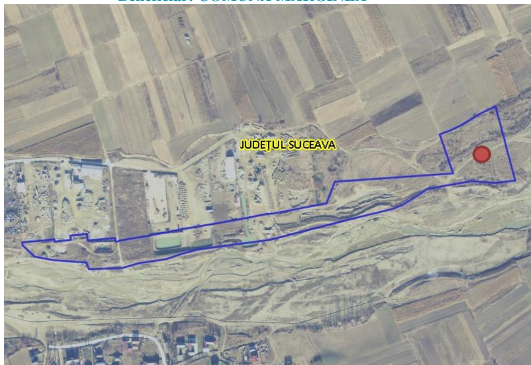
Fig. 1. Plan de amplasare în zonă

– distanța față de granițe pentru proiectele care cad sub incidența Convenției privind evaluarea impactului asupra mediului în context transfrontieră, adoptată la Espoo la 25 februarie 1991, ratificată prin Legea nr. 22/2001, cu completările ulterioare;