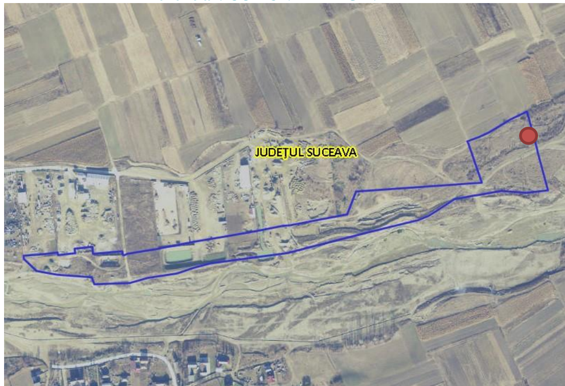
Fig. 1. Plan de amplasare în zonă

Imobilul constituie domeniul privat al Comunei Marginea și se identifica prin parcela cu nr. cadastral 36729 (S=58.400mp), înscrisă în CF nr. 36729 a UAT Marginea conform extrasului de CF pentru informare eliberat de OCPI Suceava.